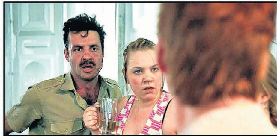
Scènes uit de voorstelling 'Venlo' van de Rotterdamse acteursgroep Wunderbaum.