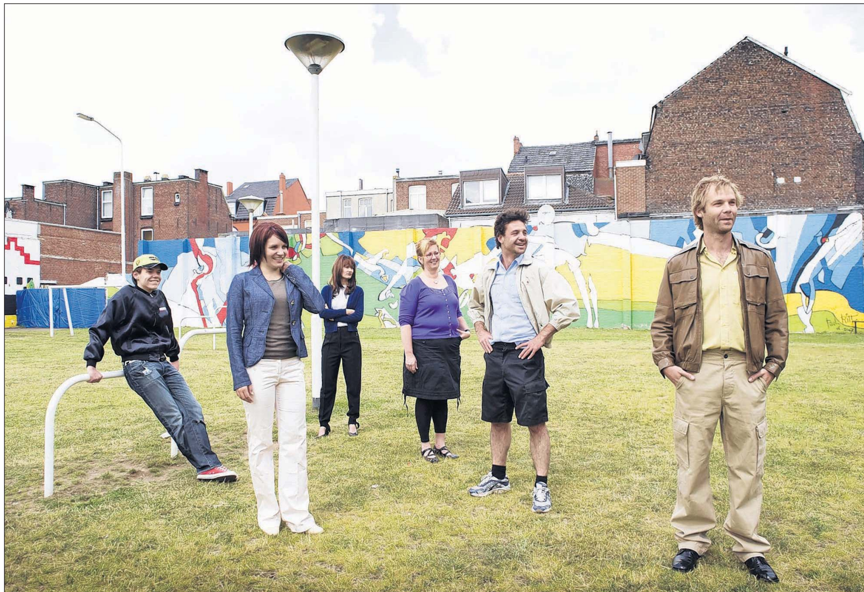
Wunderbaum op de Speelpleq, daar waar de Venlonaar in juni een spiegel wordt voorgehouden.